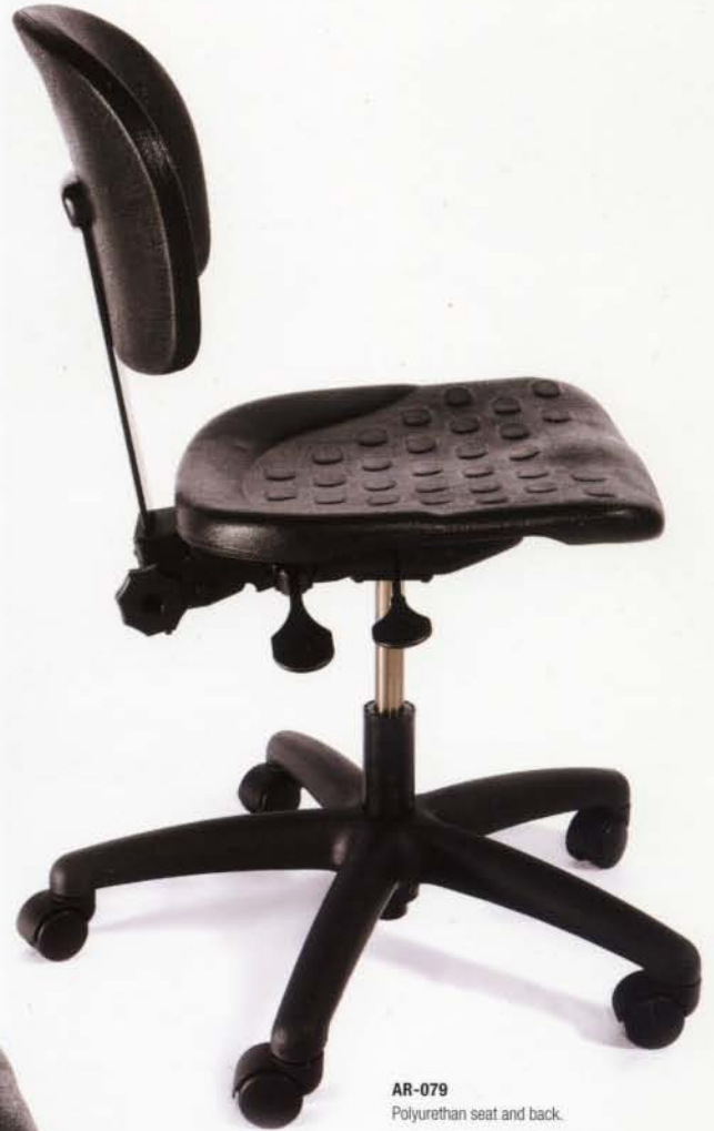
AR-079 Polyurethan seat and back. Assise et dossier profilés en polyurethane. Control/Mécanisme : 78 Base : Black/Noire