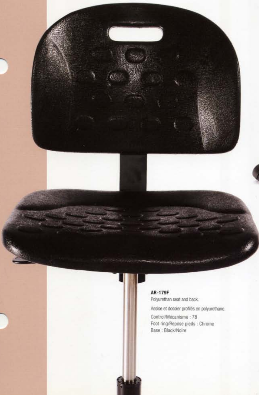
AR-179F Polyurethan seat and back. Assise et dossier profilés en polyurethane. Control/Mécanisme : 78 Foot ring/Repose pieds : Chrome Base : Black/Noire