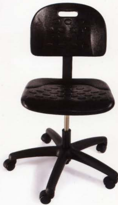
AR-079 Polyurethan seat and back. Assise et dossier profilés en polyurethane. Control/Mécanisme : 78 Base : Black/Noire