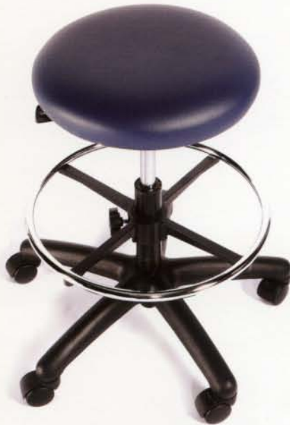
AR-068F 8 1/2" pneumatic adjustable height. Upholstered seat. Réglage pneumatique de la hauteur sur 8 1/2 po. Assise rembourée. Fabric/Tissu : Vinyle «Spirit bleu» Foot ring/Repose pieds : Chrome Base : Black/Noire