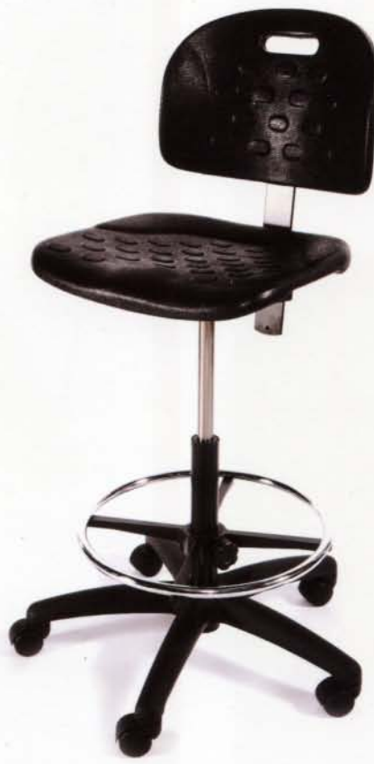
AR-179F Polyurethan seat and back. Assise et dossier profilés en polyurethane. Control/Mécanisme : 78 Foot ring/Repose pieds : Chrome Base : Black/Noire